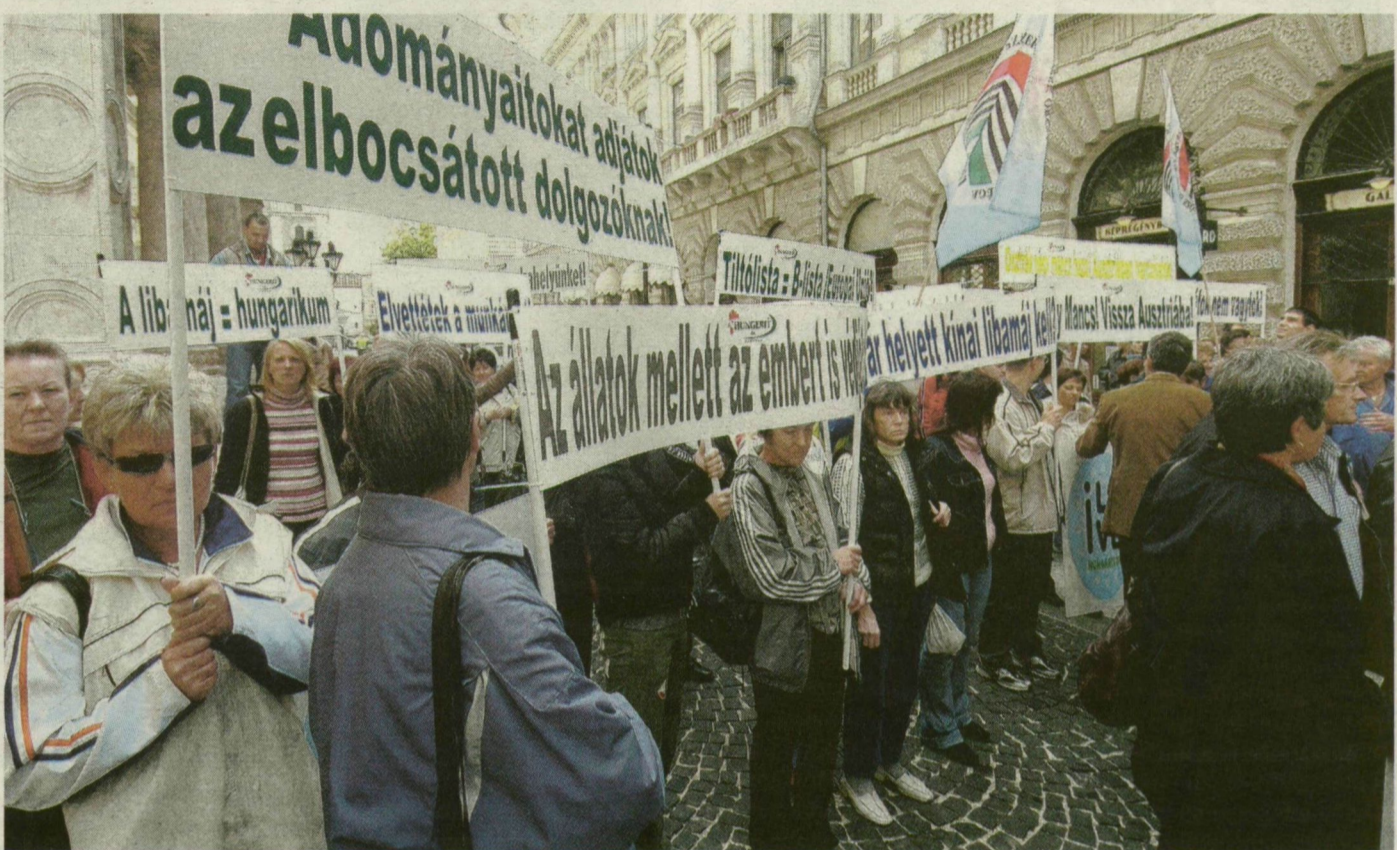
■ A SZENTESIEK BUDAPESTEN TŰNTETTEK A NÉGY MANCS ELLEN – AZ Ő EGY SZÁZALÉKUKRA MÁR ALIGHA SZÁMÍTHAT AZ ALAPÍTVÁNY

A Négy Mancs eredetileg egy kis állatvédő szervezet, irodá-