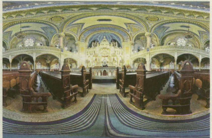
A SZEGEDI ZSINAGÓGA BELSEJE - SAJÁTOS SZEMSZÖGBŐL

ezen szeretnék változtatni e munkámmal, és szép fokozatosan elérni azt, hogy az ország ezáltal is ismertebbé váljon a világhálón - összegzi küldetését a fotós. - Az oldalak látogatottsága megnyugtatóan visszaigazolta számomra azt, hogy jó úton járok, érdekes, népszerű és sokoldalúan felhasználható munkát végzek.