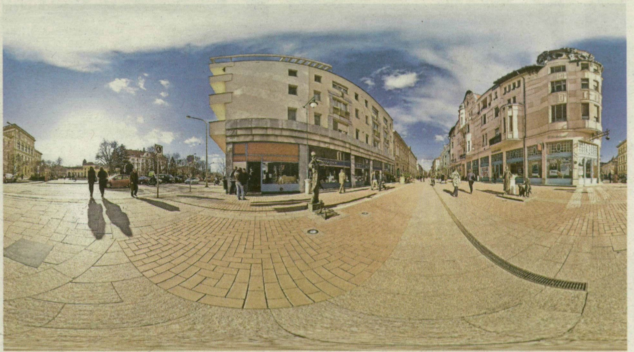
ÍGY FEST A „KIFORDÍTOTT” KÁRÁSZ UTCA