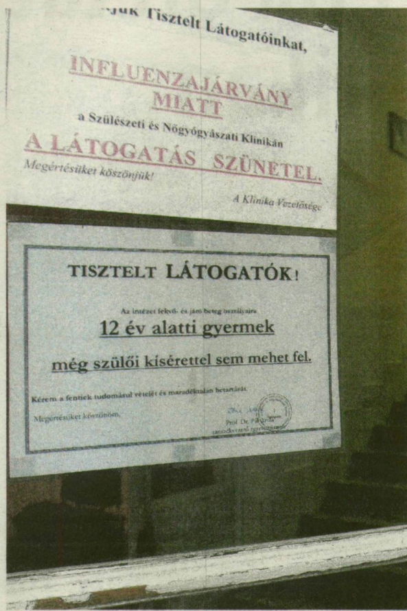
■ A NŐI KLINIKÁRÓL MÁR TEGNAP KITILTOTTÁK A LÁTOGATÓKAT

ványt okozó A típusú vírust mutatták ki a fertőzöttektől levett mintákból.