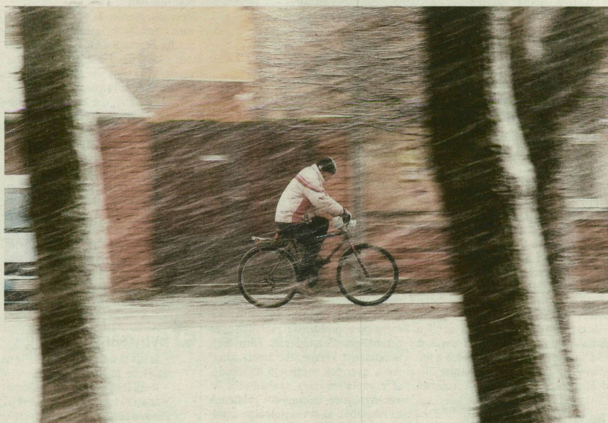
■ TEGNAP A KERÉKPÁR NEM VOLT KÉNYELMES KÖZLEKEDÉSI ESZKÖZ A SZAKADÓ HŐESÉSBN