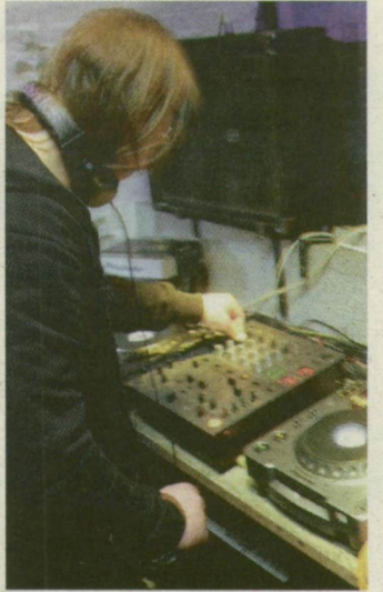
■ DJ A JATE-KLUBBAN. SZEGEDEN KÖRÜLBELÜL NEGYVENEN DOLGOZNAK

DJ Egon, ahogyan a DJ-k 70-80 százaléka, tagja a Magyar Lemezlovasok Egyesületének. Évente 24 ezer forintot fi-