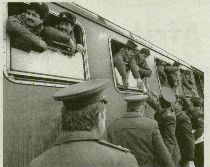
■ VÉGSŐ BÚCSÚ DOROZSMÁN

18 évvel ezelőtt az emberek már nemigen emlékeztek a háborúban elkövetett erőszakra, az 1956-os megtorlásra. Orosztanárok rendszeresen látogatták orosz tisztok – tanítás alatt az iskolában. A zdráštvojtye után rögtön egy üveg vodkát nyomtak a kezébe az aranyfogú tisztok. Mi meg úgy tettünk, mintha semmit se láttunk volna.