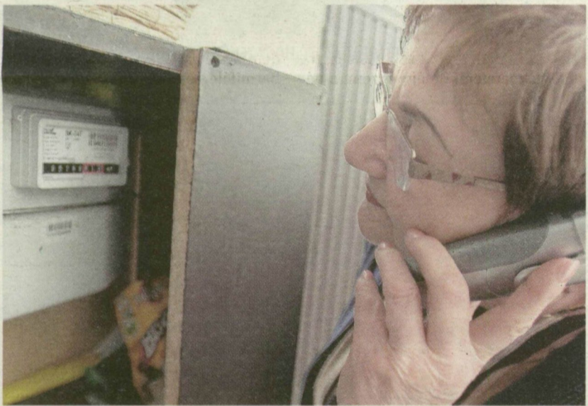
TASNÁDINÉ ICUKA CSAK ANNYIT FIZET, AMENNYI SZÜKSÉGES

VILLANY-ELŐFIZETŐK. A Démász fogyasztói több mint 10 milliárddal tartoznak, és az összeg egyre emelkedik. Ettől függetlenül a havi órállást bejelentők száma nem nő. Az áramszolgáltatónál 5 éve kérhető előrefizetés óra, a régióban 100-at töltenek folyamatosan. Védendő - szociálisan rászoruló vagy fogyatékkal élő - fogyasztók kérésére ingyen felszerelik. Másoknak nettó 13 ezer 287 forint a szolgáltatás, a mérő ára pedig 17 ezer 140 vagy 44 ezer forint, fáziszámtól függően.