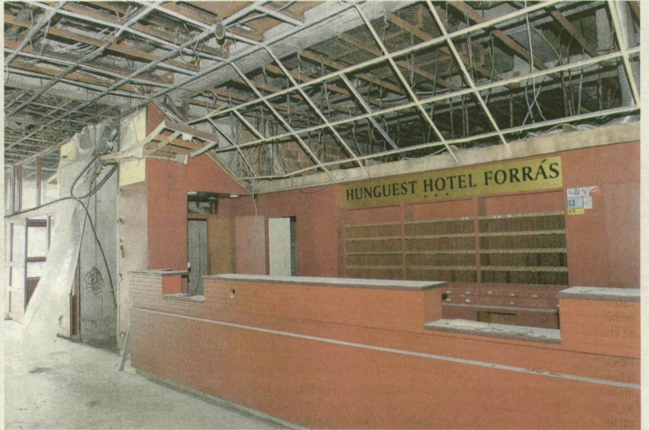
MOST ÍGY NÉZ KI A KIÜRÍTETT SZÁLLÓ VOLT RECEPCIÓJA