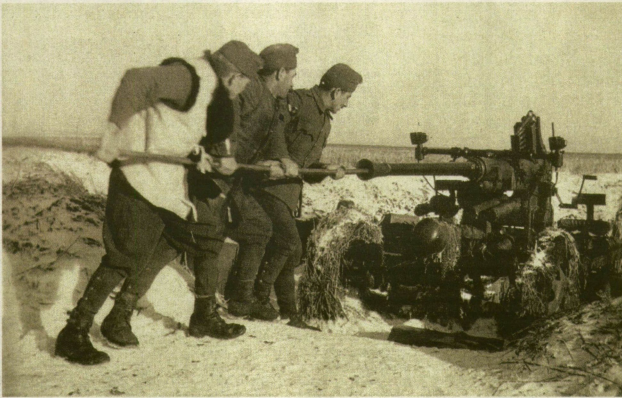
■ Légvédelmi géppágyú tüzelőállásban – a Donnál

„Az ellenség harctevékenységének bizonyos fokú megélénküléséről számol be” a honvéd vezérkar 36. számú hadijelentése január 8-án. Egy nappal később Ferencz Gyárfás aláírással közlünk pillanatfelvételt a „Donmenti állások”-ról: a „vállalkozás”, vagyis három bunker felrobbantása közben „pokollá változik a táj... A még elébb csendes vidék ordít, bömböl, ugat és vonaglik... Tüzérségünk és gyalogságunk nehézfegyverei, tüzgépei zárótűzzel támogatják rohamjárőrünk munkáját. (...) Kézigránát kézigránátot ér, miközben a vörös aknavetők is ugatni kezdenek... Kegyetlenül verik a Don vonalát...”