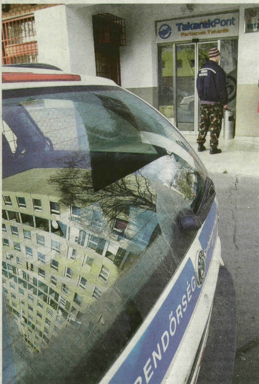
A RETEK UTCÁBAN A HELYSZÍNELŐK BEJÁRTÁK A TEREPET

A pár percig tartó akció után a férfi a bank hátsó bejárata felé szaladt, a Póz Jenő utca irányában gyalog menekült el a helyszínről. Néhány ügyfél ugyan utána eredt, míg a többiek a rendőrséget hívták, de a férfi eltűnt a pánélházak kö-