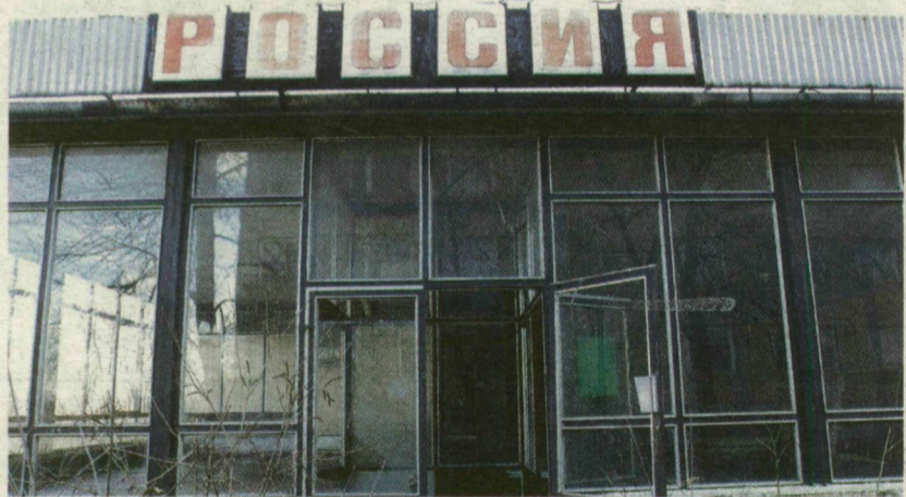
■ MOST ILYEN: ROMOS ÉPÜLET A VOLT SZOVJET LAKTANYÁBAN