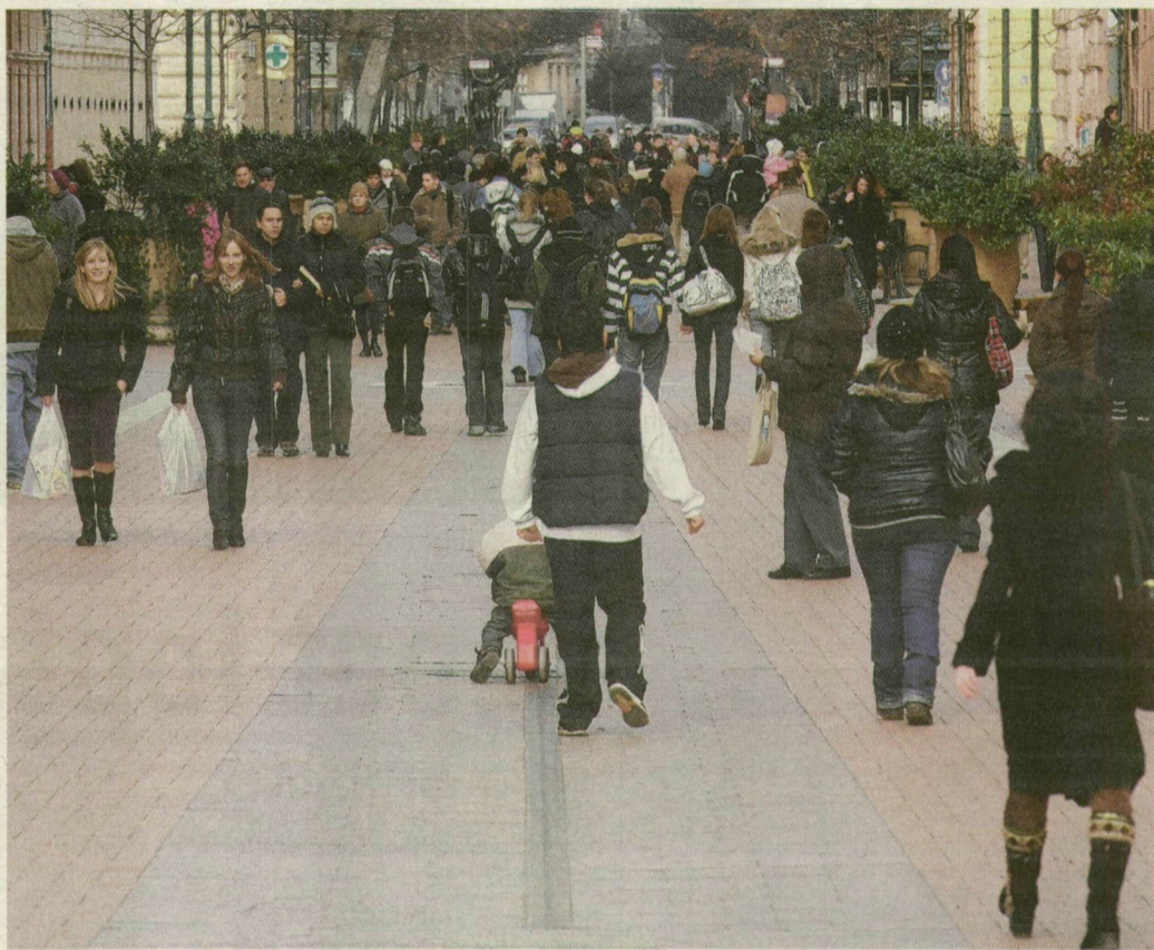
A TÚLSÚFOLT VÁROSOKBAN INKÁBB LÁNYOK SZÜLETNEK

még mindig közel kétezer fővel többen halnak meg megyénkben, mint ahányan világra jönnek. A halál statisztika azt mutatja: 1999-ben hunytak el a legtöbben, 6292-en Csongrád megyében. Azóta 5700-5800 haláleset történik évente - a legjobb év ebből a szempontból 2006 volt, amikor „mindössze” 5504-en távoztak az élők sorából. A hivatalnak tavalyról még nincs pontos adat-