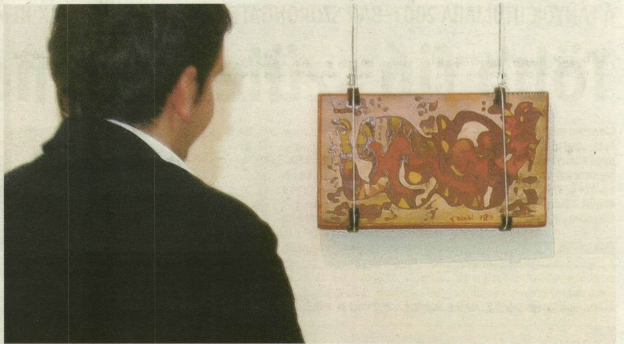
■ CSAK NÉZÜNK: ÚGY TUDJUK, EZ A KÉP TÚNT EL NÉHÁNY ÓRÁRA AZ EF ZÁMBÓ-KIÁLLÍTÁS RÓL