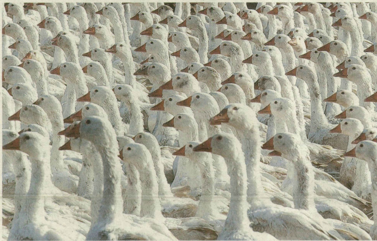
MAGYAR LIBÁK, SORAKOZÓ! VIGYÁZÓ SZEMÜKET STOCKHOLMRA VETIK