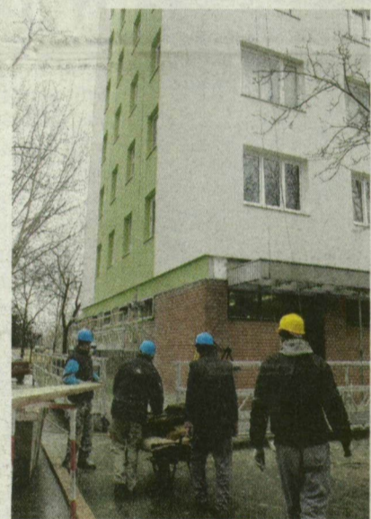
A VÉRTÓI ÚTON BEFEJEZTÉK A FELÚJÍTÁST