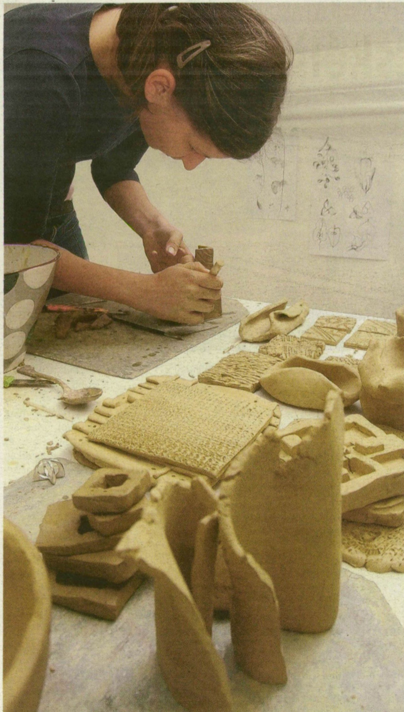
VÁSÁRHELYEN NAGY HAGYOMÁNYAI VANNAK A KERÁMIÁNAK

Az egykor szebb napokat látott vásárhelyi majolikagyár a helyi termékek, kismesterségek plázájaként élhet újjá. Tizenkét európai város közös nyertes pályázatának köszönhetően kétéves program indult be a kerámia és a régi mesterségek megőrzésére Vásárhelyen. A 540 millió forintos projektben a kultúrára épülő turizmust és a régi mesterségek termékeinek eladását tervezik.