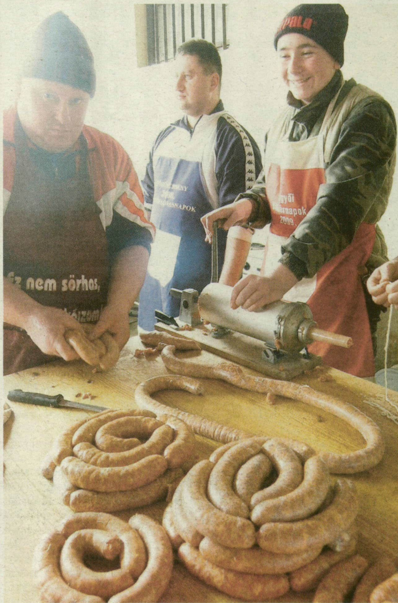
AZ ALGYŐI TERMÉSZETVÉDŐ HORGÁSZEGYESÜLET KOLBÁSZAI

- Úgy gondoltam, Algyőn is van annyi civilszervezet, baráti társaság és család, hogy összefogással megva-