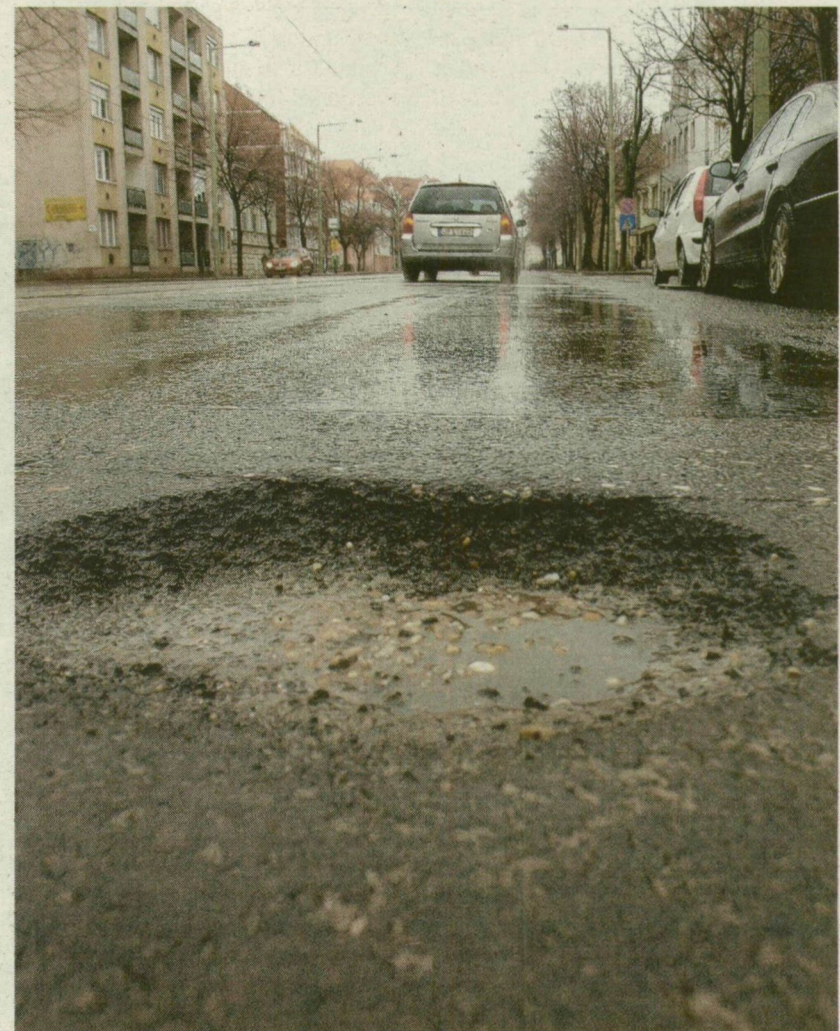
■ NAGYOT ZÖTTYENHET A LYUKBAN A KERÉK

A városon átmenő 5-öst, 43-ast és 45-öst felügyelő Magyar Közút Kht.-nál megtudtuk, ők nem külön brigádot vetnek be, hanem rendszeresen járőröző útellenőreikhez csatlakozik két útjavító ember. A villamossínek mentén 80 centi széles út az SZKT fennhatósága alá tartozik, ők is figyelnek, javítanak. Az önkormányzati utak foltozására az idei költségvetés terhére 6 millió forintos szerződést kötött a környezetgazdálkodás a Szegedi Magas- és Mélyépítő Zrt.-vel. Dolgoznak is, ahol hozzáférnek.