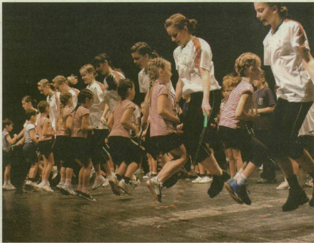
■ TIZENKÉT ÉVE UGRÁLNAK MÓRAHALMON