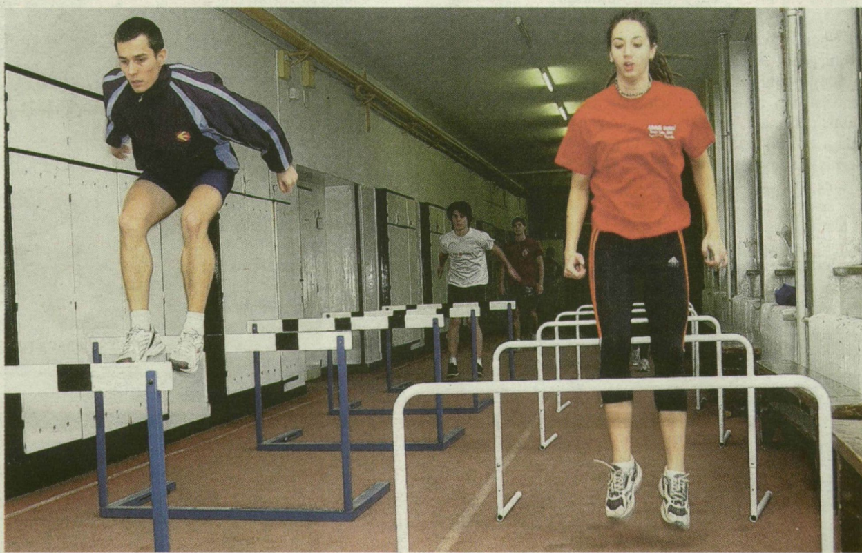
■ TESTNEVELÉSÓRA A SZÉCHENYIBEN. VESZIK AZ AKADÁLYOKAT

Hasonlóan vélekednek a Széchenyiben is. - A sportiskolai, illetve az álta-