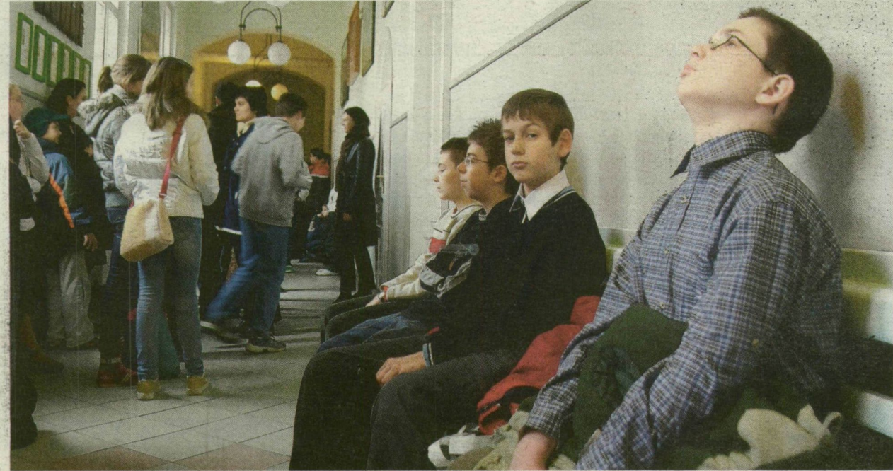
FELVÉTELI A RADNÓTIBAN. AKADT GYEREK, AKIT ALAPOSAN MEGVISELT ÉLETE ELSŐ ILYEN MEGPRÓBÁLTATÁSA

Magyarból és matematikából tartottak tegnap felvételit az ország hatosztályos gimnáziumaiban. A 12 éves diákoknak kétszer 45 perc állt rendelkezésükre a tesztlapok kitöltésére. A magyar feladatsort könnyebbnek találtuk, miközben megállapítottuk: nem haszontalanok a televízióban látható telefonos játékok.