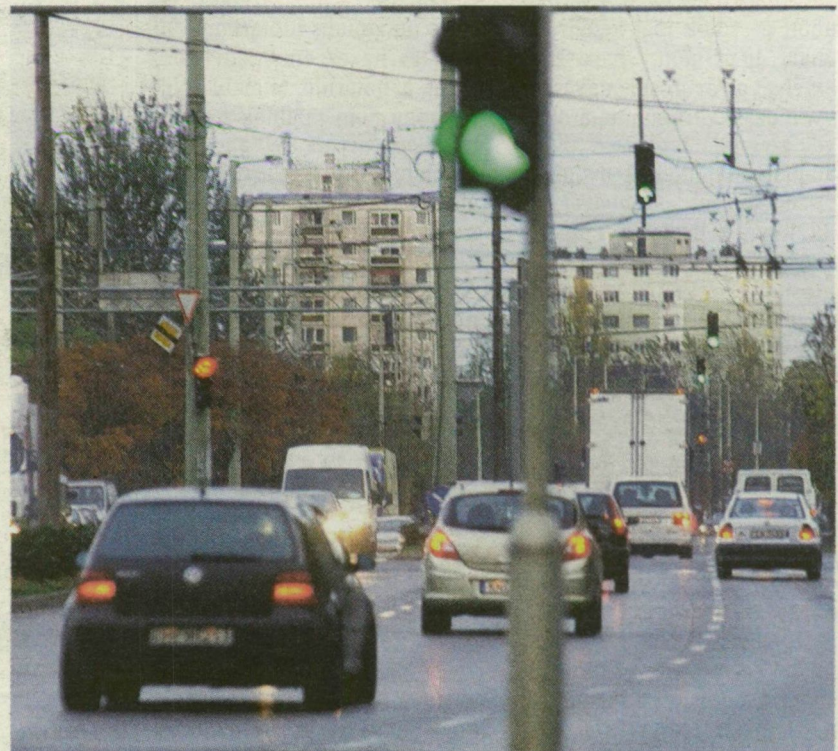
A ZÖLD LÁMPÁNÁL SOKSZOR MAGUNK LASSÍJUK LE A FORGALMAT