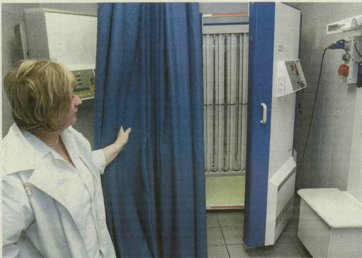
A PIKKELYSÖMÖR GYÓGYÍTÁSÁT SZOLGÁLÓ UV-KABIN A BÖRGYÓGYÁSZATI KLINIKÁN