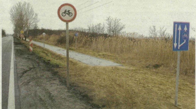
MOST A SEMMIBE VEZET - NYÁRRA KIDERÜL, MIKOR ÉPÜLHET TOVÁBB

Ma merész ember az, aki elbiciklizik a félbemaradt úton „koppanásig”: a 43-as út padkája sáros, ezért amikor a kamionok lehajtanak az aszfaltról, a messzire fröccsenő, vastag sár néhány helyen a kerékpárutat is végigveri.