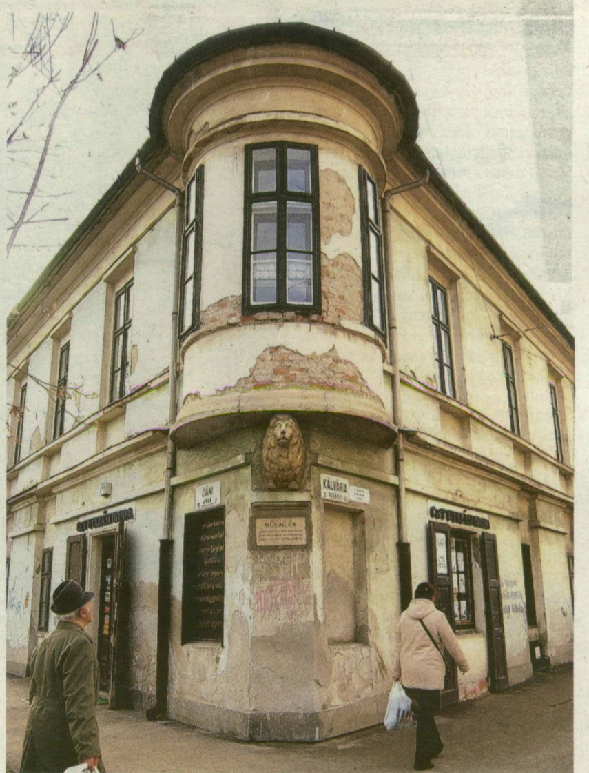
■ ELSŐK KÖZÖTT KAPOTT MŰEMLEKI VÉDELTSÉGET A DÁNI-HÁZ