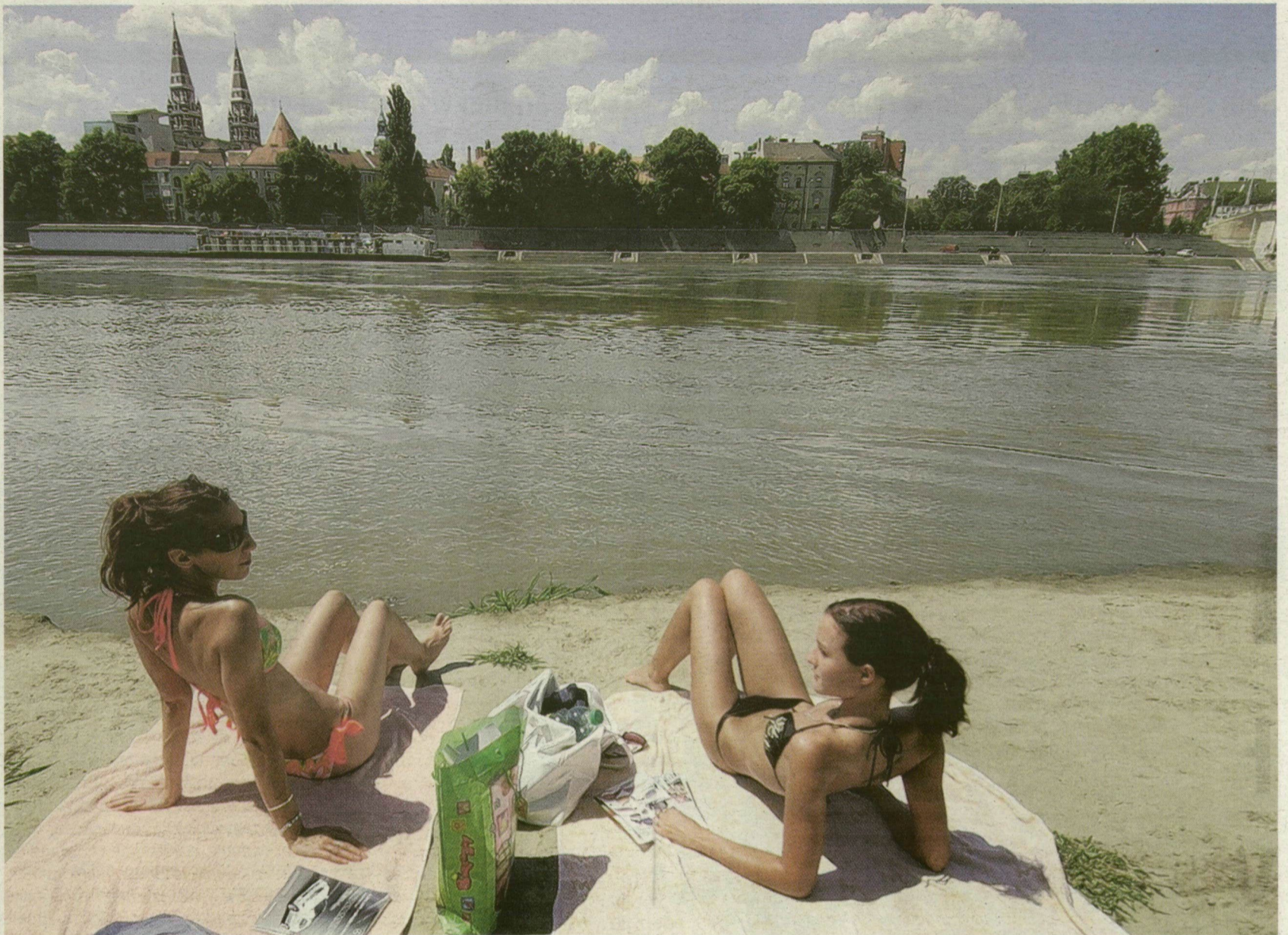
■ NAPFÉNY, TISZA – ÉS SZÉP LÁNYOK. MINDHÁROM MIATT SZERETJÜK SZEGEDET

6. Anna-víz. Szeretjük az Anna-vizet, amely generációk izületeit gyógyította, a kutat, amelyhez ezrével járnak az emberek újra meg újra megtölteni kannáikat, hiszen bevált a kúra.