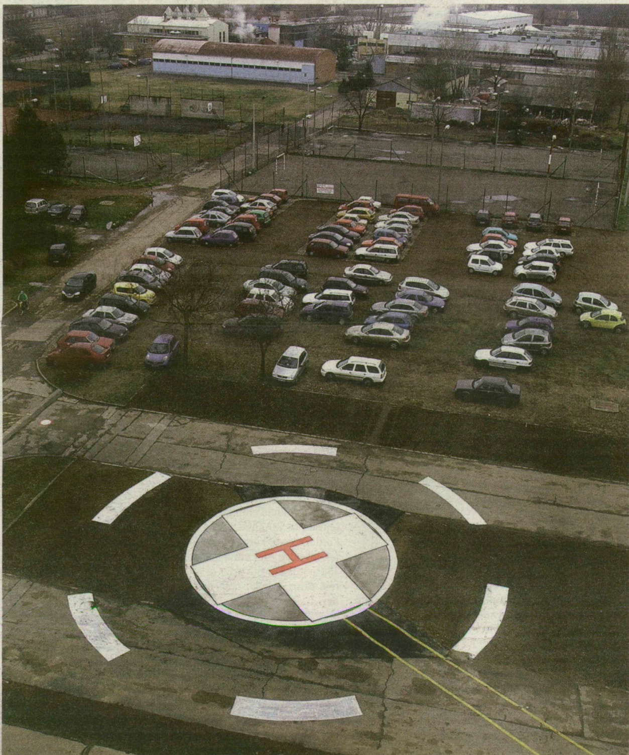
A SZEGEDI KLINIKA LESZÁLLÓPÁLYÁJÁT SEM VILÁGÍTJÁK KI SÖTÉTBEN