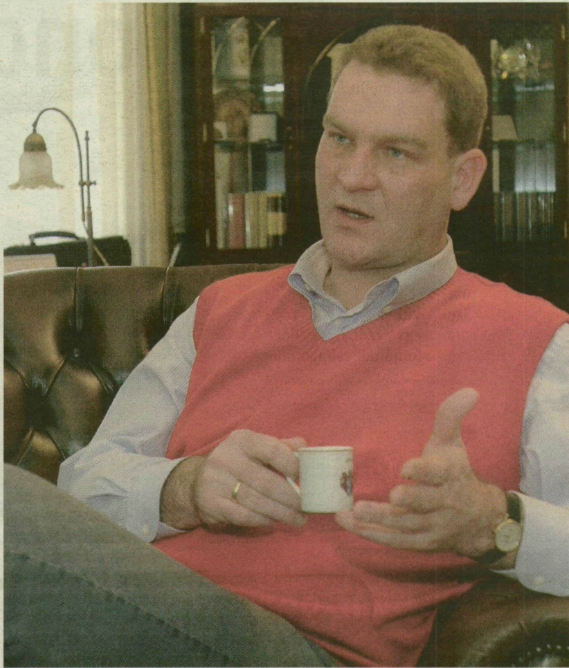
■ BOTKA LÁSZLÓ POLGÁRMESTER: AZ ÖNKORMÁNYZAT CSAK AZ EGYIK SZEREPLŐJE A VÁROSFEJLESZTÉSNEK