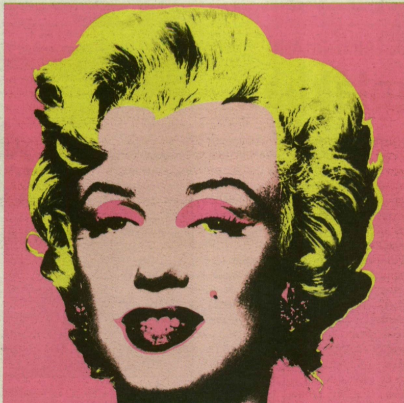
■ ANDY WARHOL: MARILYN MONROE

figurája, Andy Warhol reklámszakemberként kezdte, alkotói karrierje a hatvanas években indult el, amikor is népszerű képregények és hirdeté-