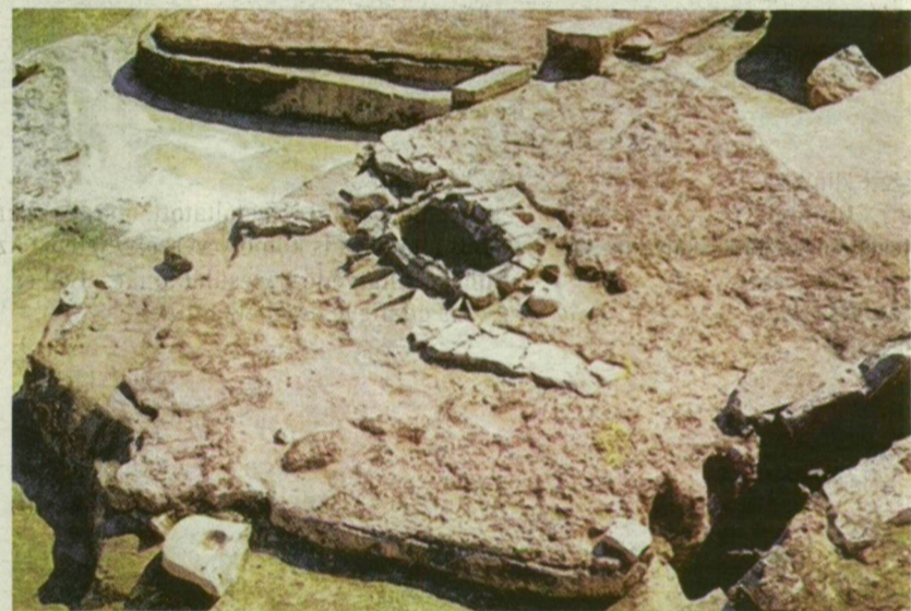
■ AZ AL-DUNAI LEPENSKI VIR SZENTÉLYE