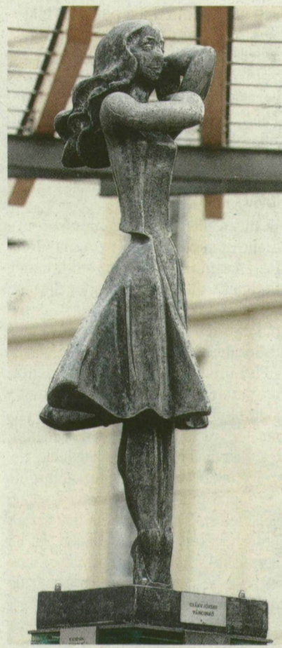
■ A TÁNCOSNŐ

Szintén a pártos parkrendezésnek esett áldozatul az árvízvédelemben nevet szerzett államtitkár Rapaics Radó. Arcmása a Stefánián 6 méteres köobeliszktetejéről figyelte a Tiszát - írja Tóth Attila . Domborműként „reinkarnálódott” portréját az Atikővizig épületének oldalába falazták. Helyet és nevet is cserélt Tápai Antal Árokiparti Vénusza. A bronzakt 1963-tól 13 évig nyújtózott az újszegedi ligetben, míg át nem vitték Tavasz néven a fűveskertbe. „Kinötte” a szűk Klauzál teret Pátzay Pál Kenyérsergője. A terebélyes bronzasszonyt 2001-ben költöztették át a kis Dugonics téri parkba.