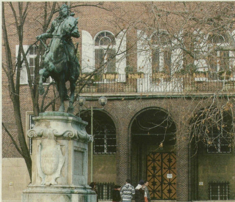
■ II. RÁKÓCZI FERENC A SZÉCHENYI TÉRRŐL LOVAGOLT AZ ARADI VÉRTANÚK TERÉRE

képviselője időközben megváltoztatta szándékát; az istenek Szegedre kerültek. Klebelsberg másik ajándéka is kalandos sorsú. A Kolozsvári testvérek sárkányölő Szent Györgynek talpata 1930-tól 9 éven át árválkodott üresen az Aradi vértanúk tere és a kémiai intézet sarkán. Rövid időre tették fel rá a harcos szentet, mert a Béke-épület építéséhez kellett a hely. Szent György a múzeum lépcsőházában húzta meg magát 20 évre. Onnan emelték magasabb talapzatra és új helyre a Rerich Béla téren.