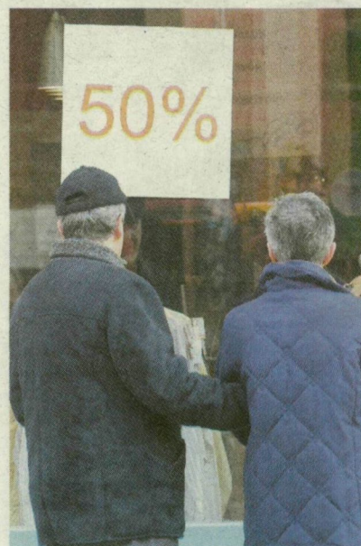
■ A SZEGEDIEK NEM MENNEK EL A LEÁRAZÁSOK MELLETT KARÁCSONY UTÁN SEM

„Adni jó... az év minden napján” – olvastuk a MediaMarktban, ahol élvezkedhet képest egészen sokan nézelődtek az elektronikai termékek között. Tóth György például olcsó kenyérpírtót keresett. – Utalványt kaptam karácsonyra, azt szeretném levásárolni – indokolt.