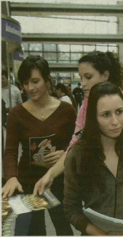
NYÍLT NAP A TIK-BEN. JÖVŐRE 12 EZER ELSŐÉVESRE SZÁMÍTANAK

Utóbbi az SZTE legfiatalabb önálló kara - 80 fős kapacitásával ráadásul a