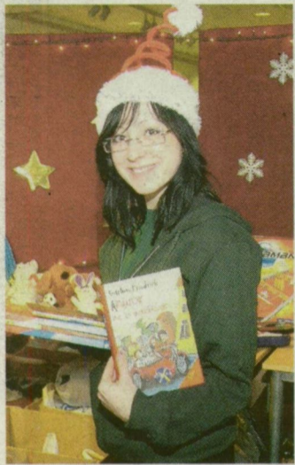
■ SZOMBATIG VÁRJUK AZ ADO- MÁNYOKAT „SZERETETKUCKÓK- BAN”

Közös jótékonyági ruha-, játék- és könyvgyűjtést szervez a József Attila Tanulmányi és Információs Központban az egyetemi könyvtár és a lapunk: szombatig várjuk az adományokat.