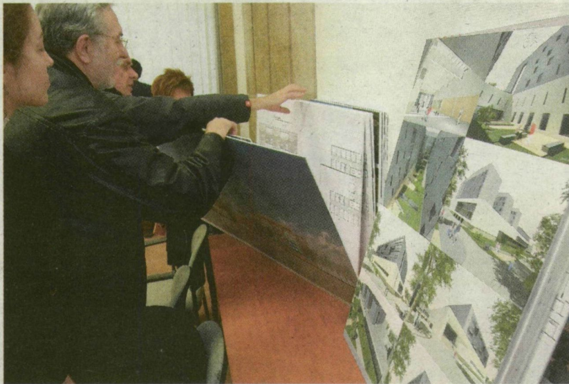
IZGALMASABBNAI IZGALMASABB RAJZOK LAPULTAK A MAPPÁKBAN

Ugyanezt mondta el kérdésünkre az egyetem rektora, Szabó Gábor, aki a zsűri elnökének tisztét látta el, de tegnap a Rectori Konferencia munkájában vett rész Pesten, ezért nem tudott jelen lenni az eredményhirdetésen.