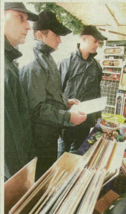
ELLENŐRÖK A KARÁCSONYI VÁSÁRBAN A SZÉCHENYI TÉREN

Néhány perc múlva kiderül, nem tévedett. Már az is gyanús, hogy a hangosbeszélő az általános gyakorlattól eltérően a következő félórán nem ismétli meg a felhívást, de volt ennél látványosabb is: mintegy 15-20 árus hátra-