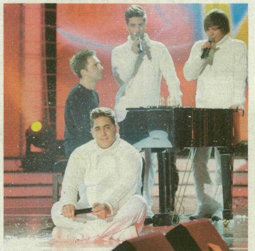
■ EZÚTTAL KRISZTIÁNNAK SZÓLT A BÚCSÚDAL