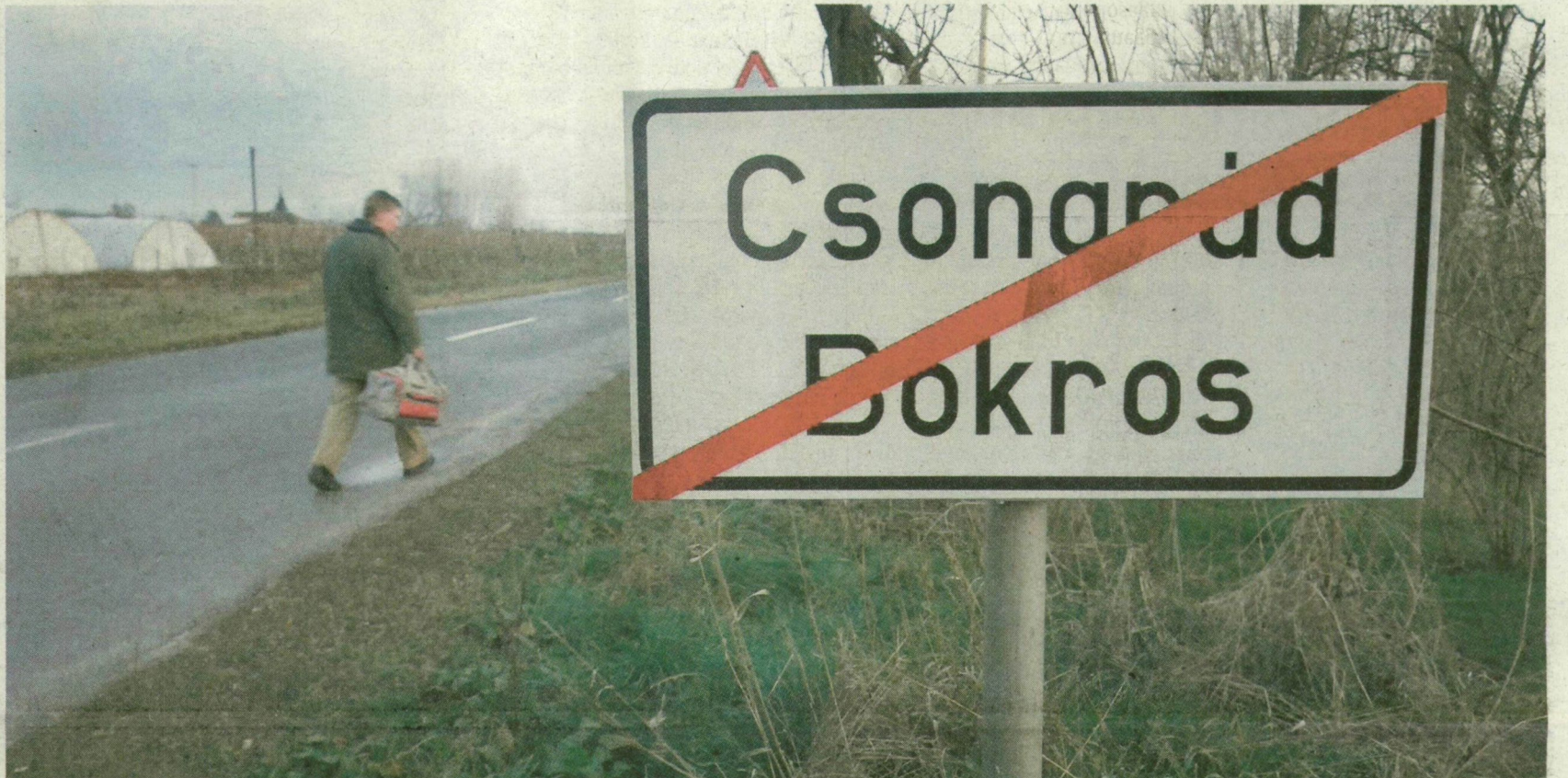
■ VÉGE CSONGRÁD ÉS BOKROS 31 ÉVE TARTÓ EGYÜTTÉLÉSÉNEK. EZENTÚL KÜLÖN UTAKON JÁRNAK

Este fél hétkor a Pipacs bisztróban népes vendégsereg gyűlt össze, és fesztelen hangulatban folyt a társalgás, de nem a népszavazásról. Egy nagyfröccsöt szorongató, idősebb férfi érdeklődésünkre elmondta, ő már szavazott ebéd után, s mivel ő volt a 241., aki így tett, nincs kétsége afelől, hogy sikerül többséget szerezniük az igennel voksolóknak. A nevét nem volt hajlandó elárulni, mondván, „főnöke” is érintett ebben az ügyben, úgyhogy jobb, ha