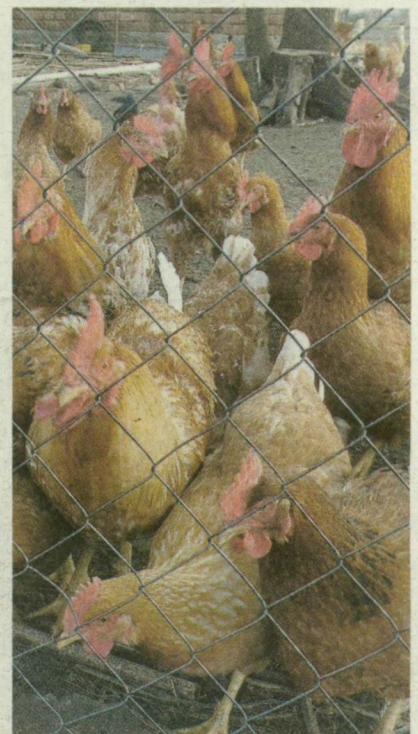
A TYÚKOK A TOLVAJOK KEDVENCEI KÖZÉ TARTOZNAK A MÓRAHALMI TANYAVILÁGBAN