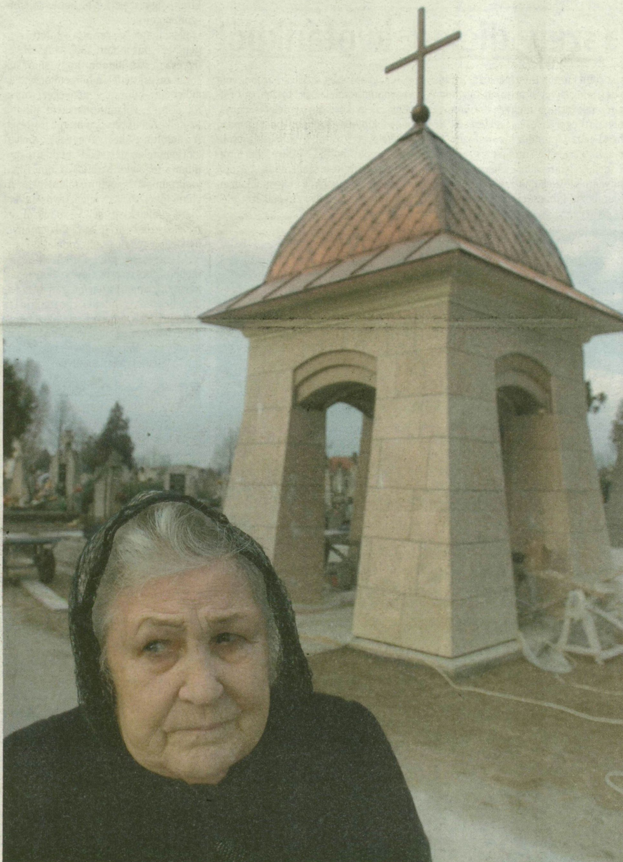
NYOLCMILLIÓ FORINTÉRT ÉPÍTTETETT KÁPOLNÁT ADOMÁNYOKBÓL A 78 ÉVES, OROSZ ASSZONY