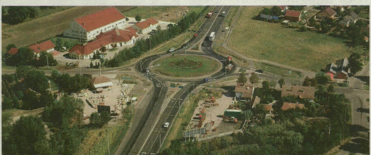
A 47-ES ÚT ÉS AZ ALGYŐI TÉGLÁS UTCA TALÁLKOZÁSÁNAK KÉTSÁVOS KÖRFORGALMÁHOZ HASONLÓ LESZ A TÖBBI IS

MUNKATÁRSUNKTÓL A születő M43-as autópályának köszönheti majd megújulását a 47-es főút Szeged és Algyő közötti szakasza. A korszerűsítés egyik oka, hogy az úttest állapota megfeleljen az uniós előírásnak, a 11,5 tonnás tengelyterhelésnek. Ez lesz az első megyénk régebben épült útjai közül, amit így megerősítenek. → Folytatás és jegyzet a 3. oldalon