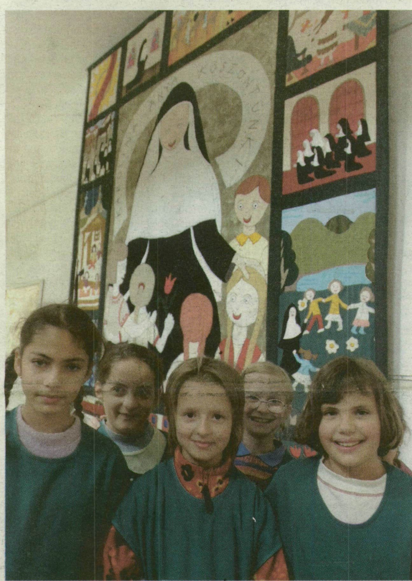
A KAROLINA NŐVÉRT ÁBRÁZOLÓ TEXTILKÉPET DIÁKOK ÉS TANÁROK EGYÜTT KÉSZÍTETTÉK