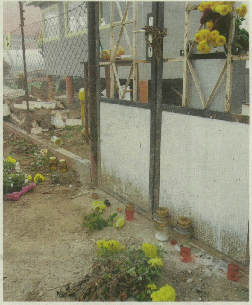
VIRÁGOK ÉS MÉCSÉK SORAKOZNAK A HÁZ ELŐTT, AMELYBEN A TRAGIKUS KETTŐS GYLKOSSÁG TÖRTÉNT

MUNKATÁRSUNKTÓL Meggyilkolt élettársa, Katica telefonjáról még SMS-eket küldött a szörnyű bűncselekménnyel gyanúsított M. Viktor Gábor a hozzátartozóknak. Azt akarta elhitetni, hogy a fiatal nő a 9 hónapos kisgyerekekkel elhagyta az országot. Ehhez hasonló hátborzongató