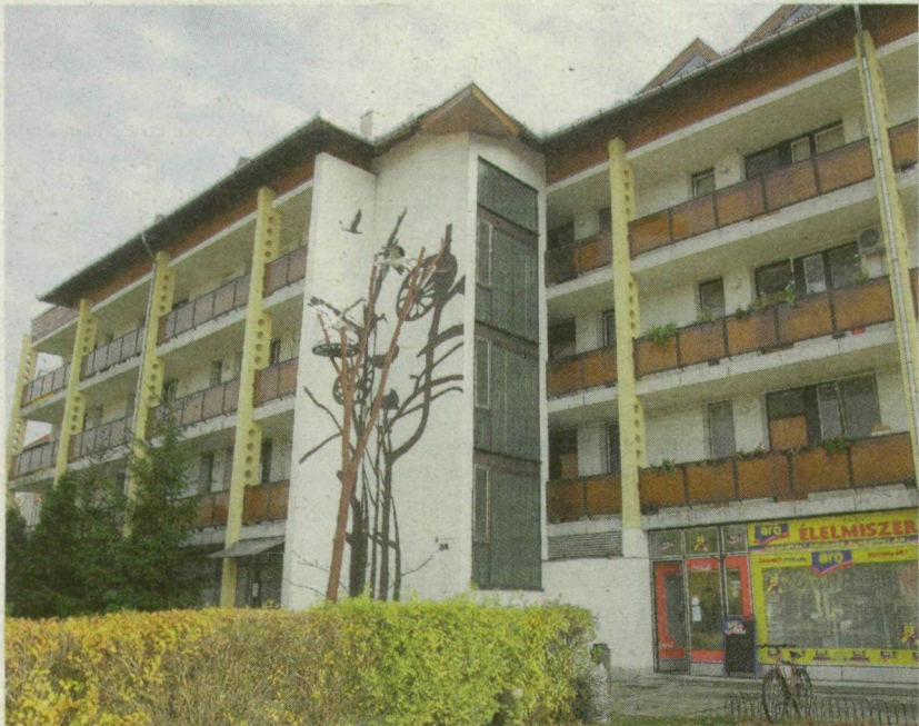
EBBEN A MÓRAALMI HÁZBAN LAKIK AZ ARAB FÉRFI CSALÁDJA