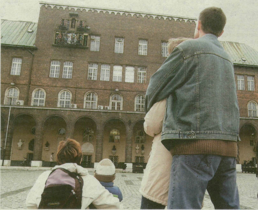
■ AZ ÓRAJÁTÉKBAN GYÖNYÖRKÖDNEK A JÁRÓKELŐK A DÓM TÉREN