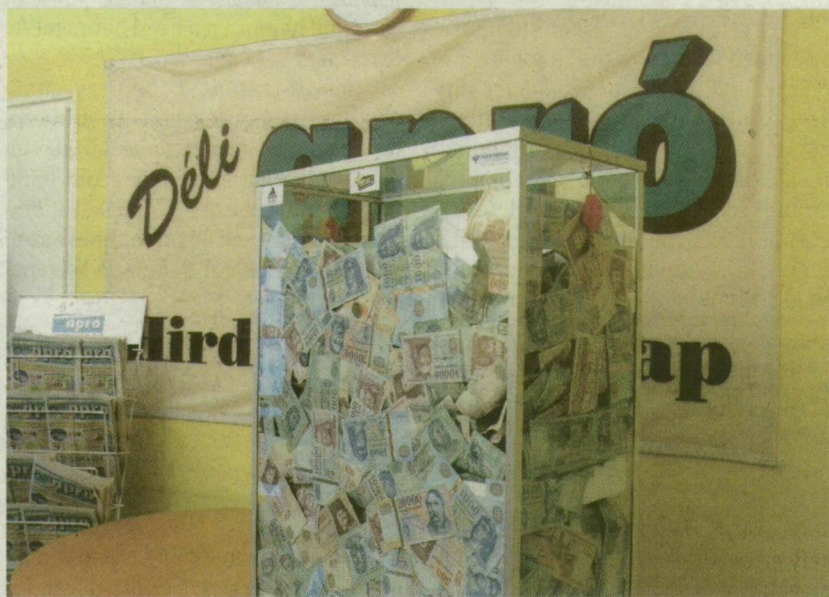
■ A LEGALÁBB MÁSFÉL MILLIÓT ÉRŐ „MÁGIKUS” ÜVEGDOBOZ A DÉLI APRÓ SZERKESZTŐSÉGÉBEN

A milliómos játék december 12-én zárul, addig is minden pénteken ki-sorsolnak 5-5 ezer forintot a szelvényes, illetve az SMS-es tippelők között. (A főnyereményt egy Volskban hitelkártyán viheti el a szerencsés tippelő vagy tippelők).