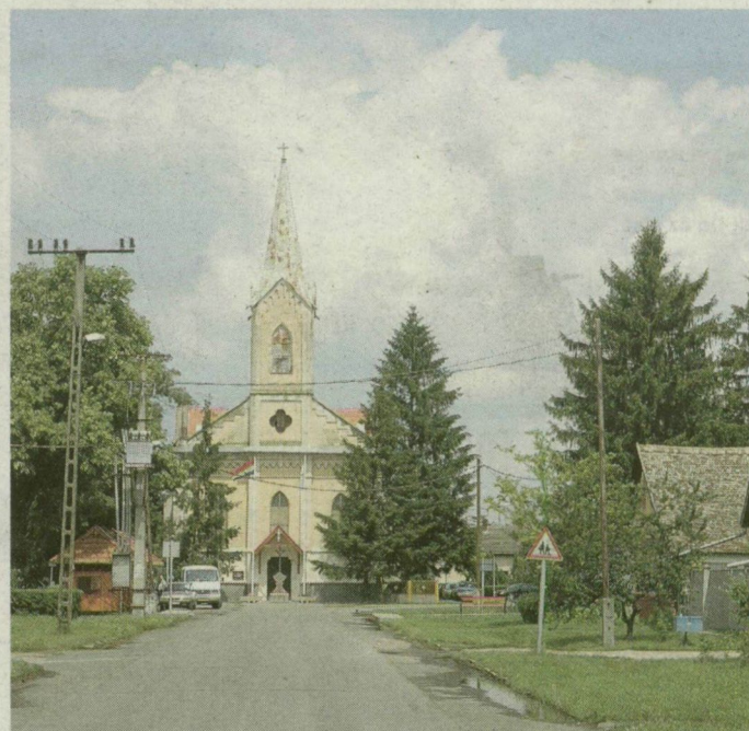
■ KIRÁLYHEGYES KÖVEGGYEL ALKOT KÖRJEGYZŐSÉGET

Az országos átlagnál kevésbé centralizálódott Csongrád megye: itt működik a második legkevesebb - összesen tíz - körjegyzőség a KSH kiadványa szerint. 20 település kötötte össze hivatalát eddig.