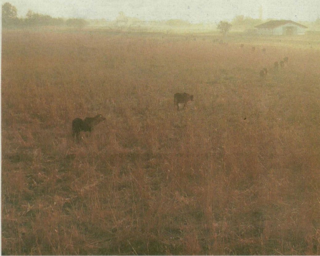
BIVALYOK – LIBASORBAN. JÁMBORAK, DE SOSEM LESZ BELŐLÜK KEZES BÁRÁNY