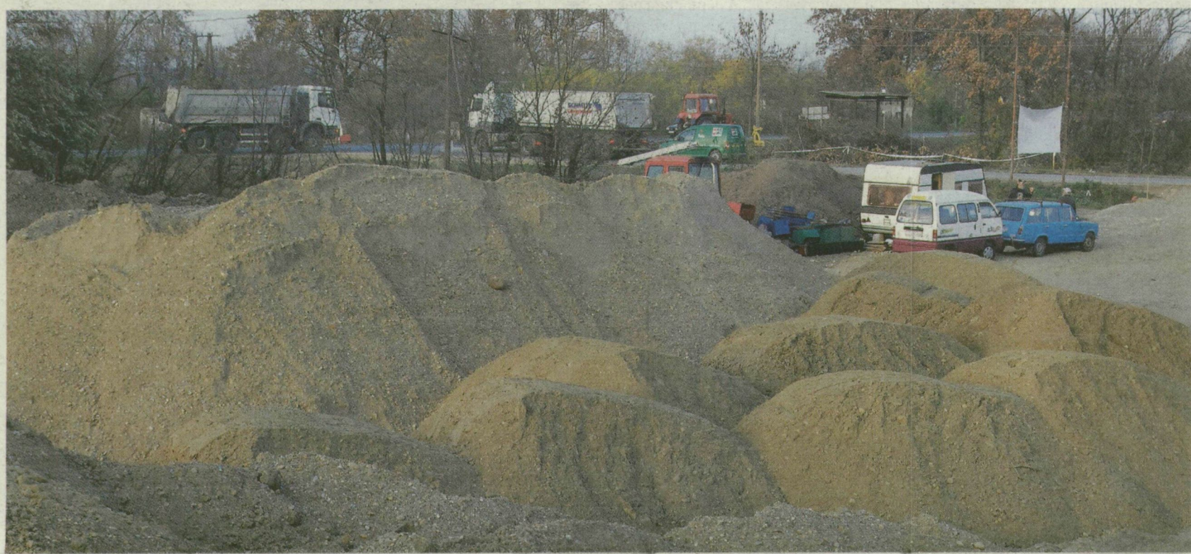
■ EZ A KŐ MÁR A LEENDŐ ÚTALAPBA KERÜL