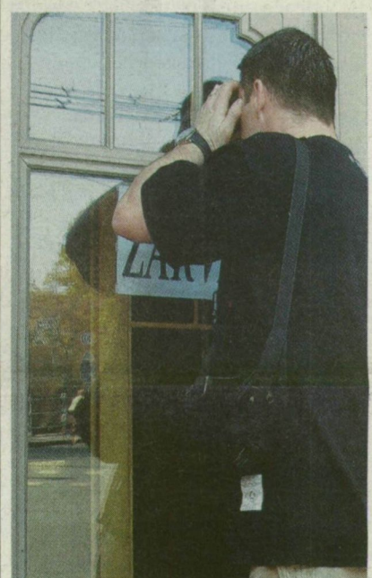
■ A KÍVÁNCSIBBAK MÁR BEKUKUCSKÁLNAK AZ É HÓNAPBAN NYÍLÓ JÁTÉKTÉR ABLAKÁN

MUNKATÁRSUNKTÓL A szegedi ellenzék egy éve azt mondta, nem azért zárja be a városvezetés a Deák utcai óvodát, mert nem felel meg a követelményeknek, hanem azért, hogy szabad utat nyisson a környéken - a kaszinóknak. A volt óvodától 150 méterre kialakították és ebben a hónapban megnyitják a Merkur játéktérmet. A Fidesz igazolva látja gyanúját, az alpolgármester azt mondja, a városnak semmi köze a játéktér engedélyezéséhez. Az engedélyező hatóságok nem beszélnek. → Cikkünk az 5. oldalon