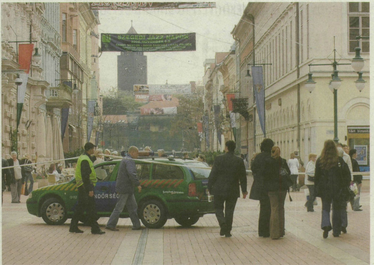
A RENDŐRÖK MINDENKIT KITERELTEK A KORDON MÖGÉ