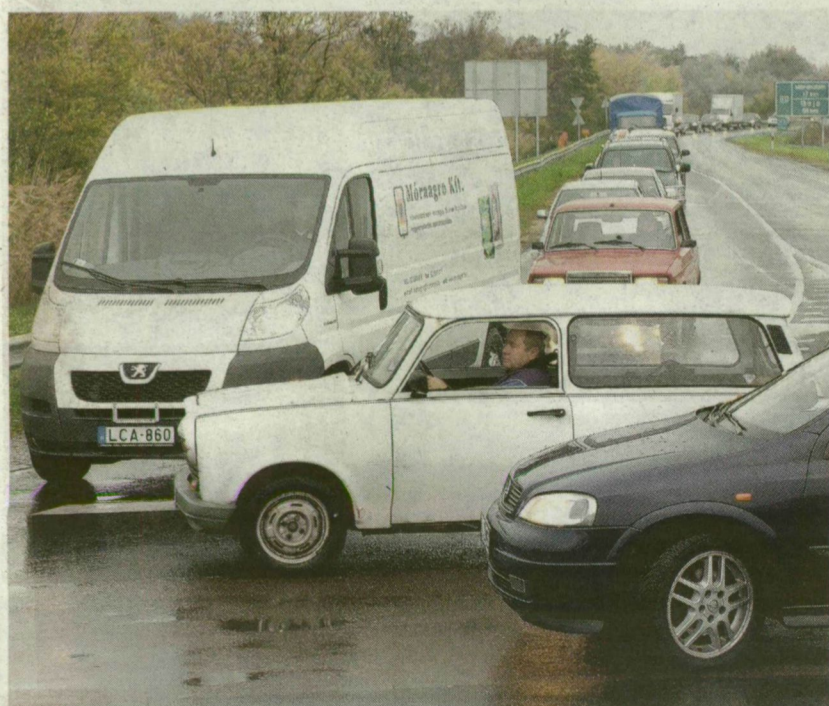
ÁLLANDÓSULT A BALESETVESZÉLY A TORLÓDÁS MIATT

A reggeli csúcs után megszűnt a dugó, napközben nagyobb fennakadás nélkül közlekedhettek az autósok.