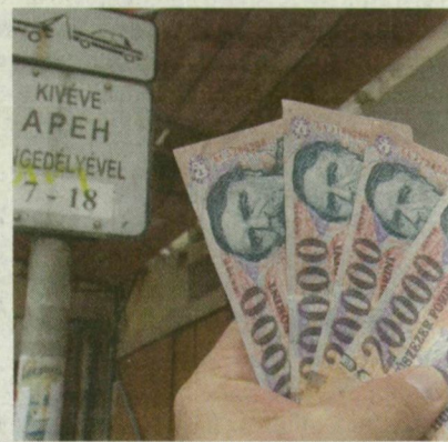
■ AZ APEH-DOLGOZÓK IDÉN MÉG MEGKAPJÁK