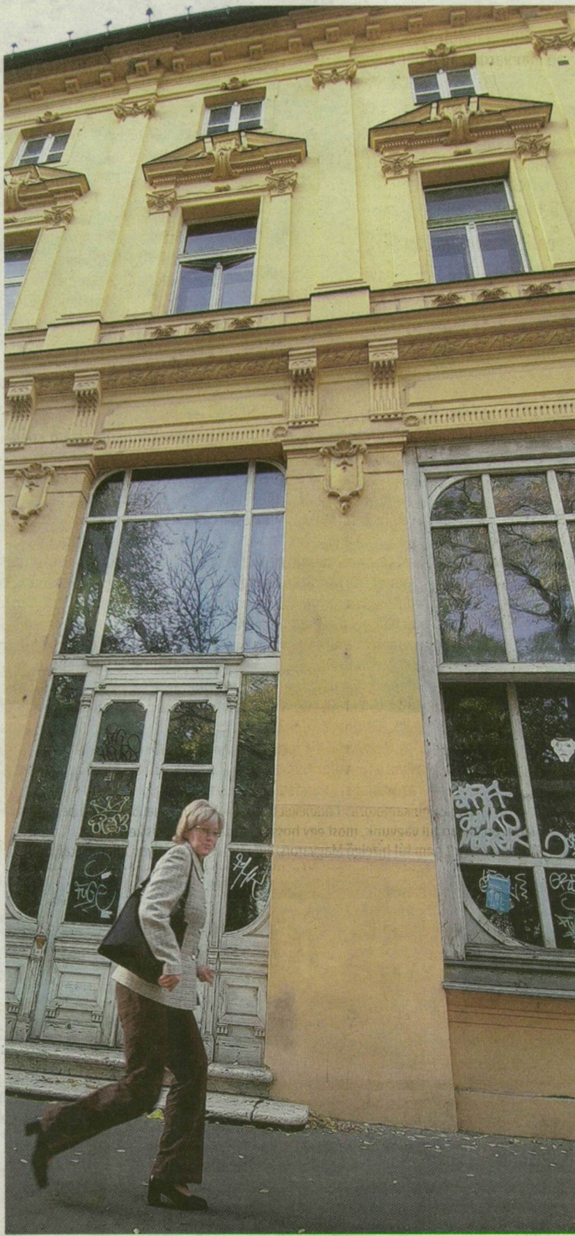
■ A BELVÁROS SZÉGYENFOLTJÁBÓL ÚJRA SZEGED JELKÉPE LESZ

további FOTÓK a témáról az interneten! www.delmagyar.hu