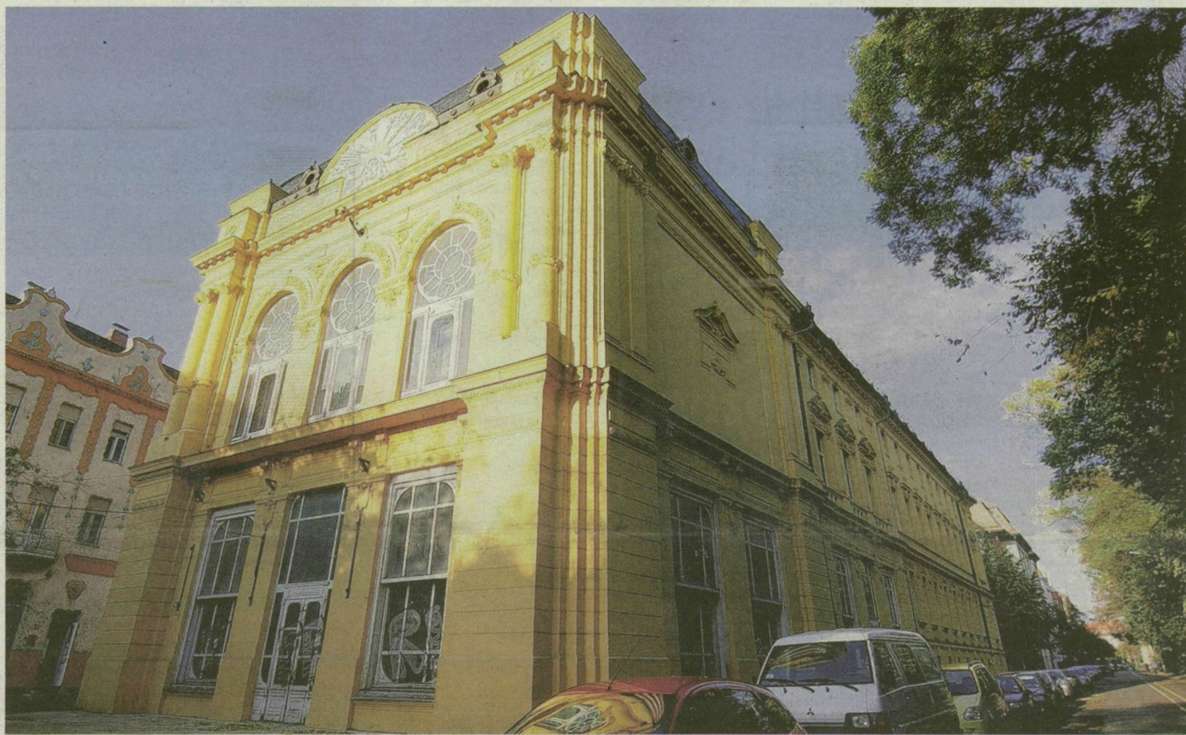
MESSZIRŐL MOST IS SZÉP. KÉT ÉV MŰLVA MÁR ÉRDEMES LESZ KÖZELEBB IS MENNI A RÉGI HUNGÁRIÁHOZ