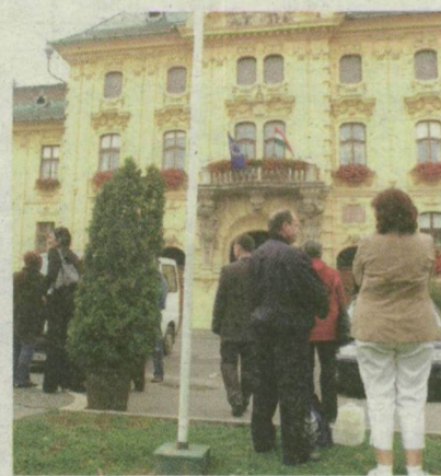
A VÁROSHÁZI DOLGOZÓKAT ELŐBB KI-, MAJD HAZAKÜLDTÉK