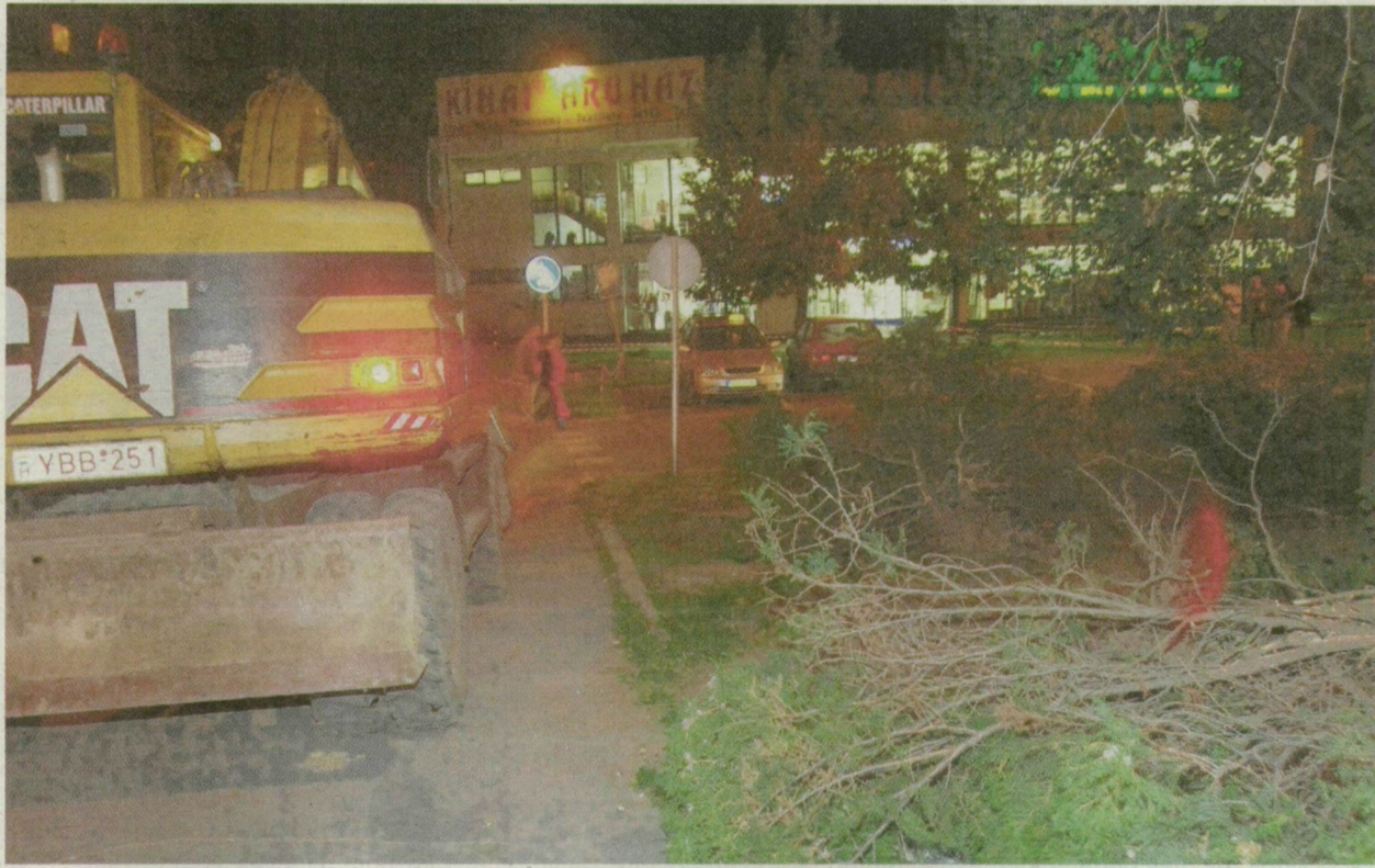
■ A KÉPEN LÁTHATÓ GÉP FORGATTA KI A FÖLDBŐL A NÖVÉNYEKET

- Öt órakor, kutyasétáltatás közben láttam, hogy mit csinálnak. A gép elé álltam, de a munkások azt mondták, hogy engedélyük van a növények ki-