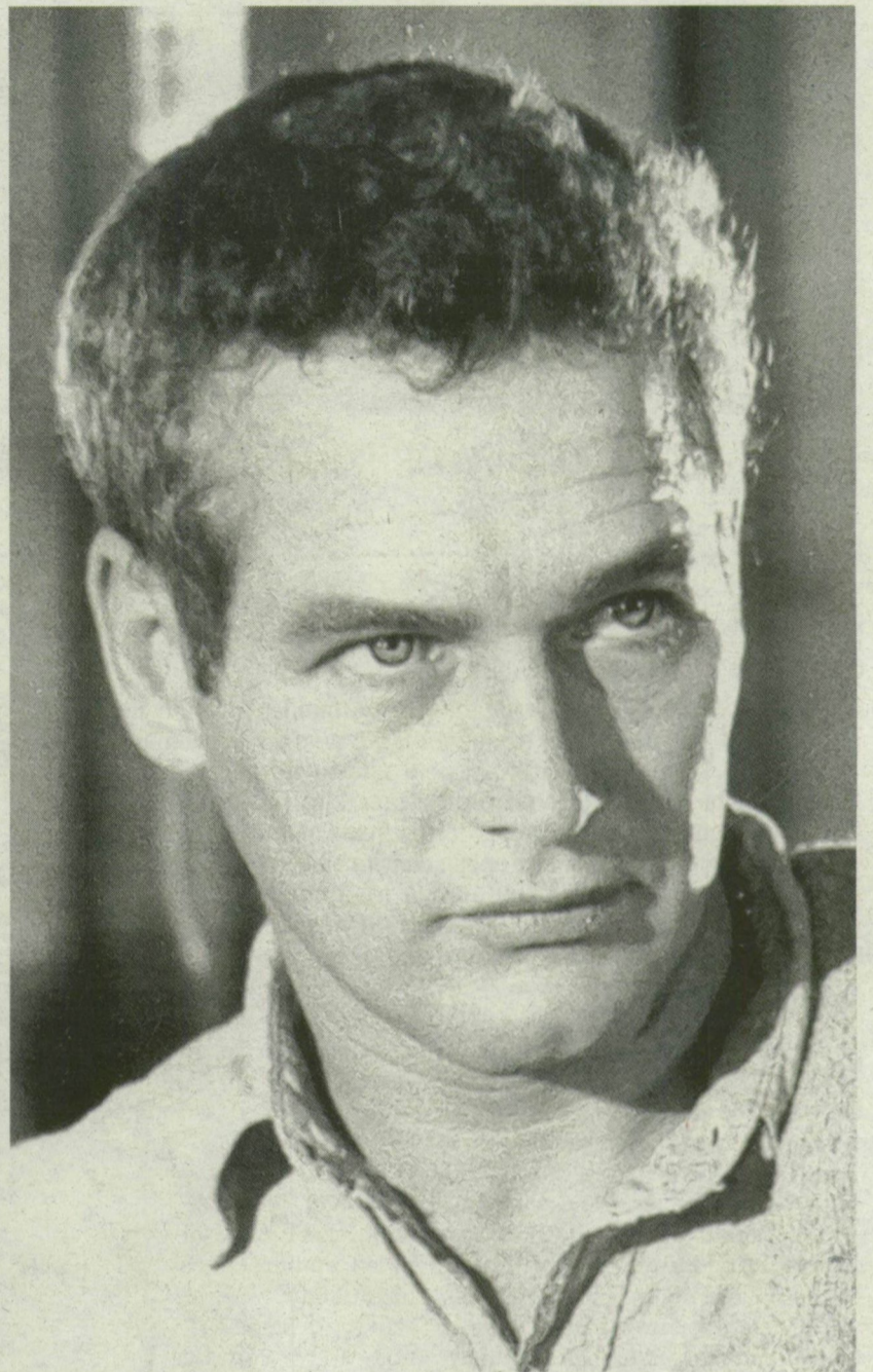
PAUL NEWMAN. A SÁRMOS SZÍNÉSZNEK MAKÓI GYÖKEREI IS VOLTAK