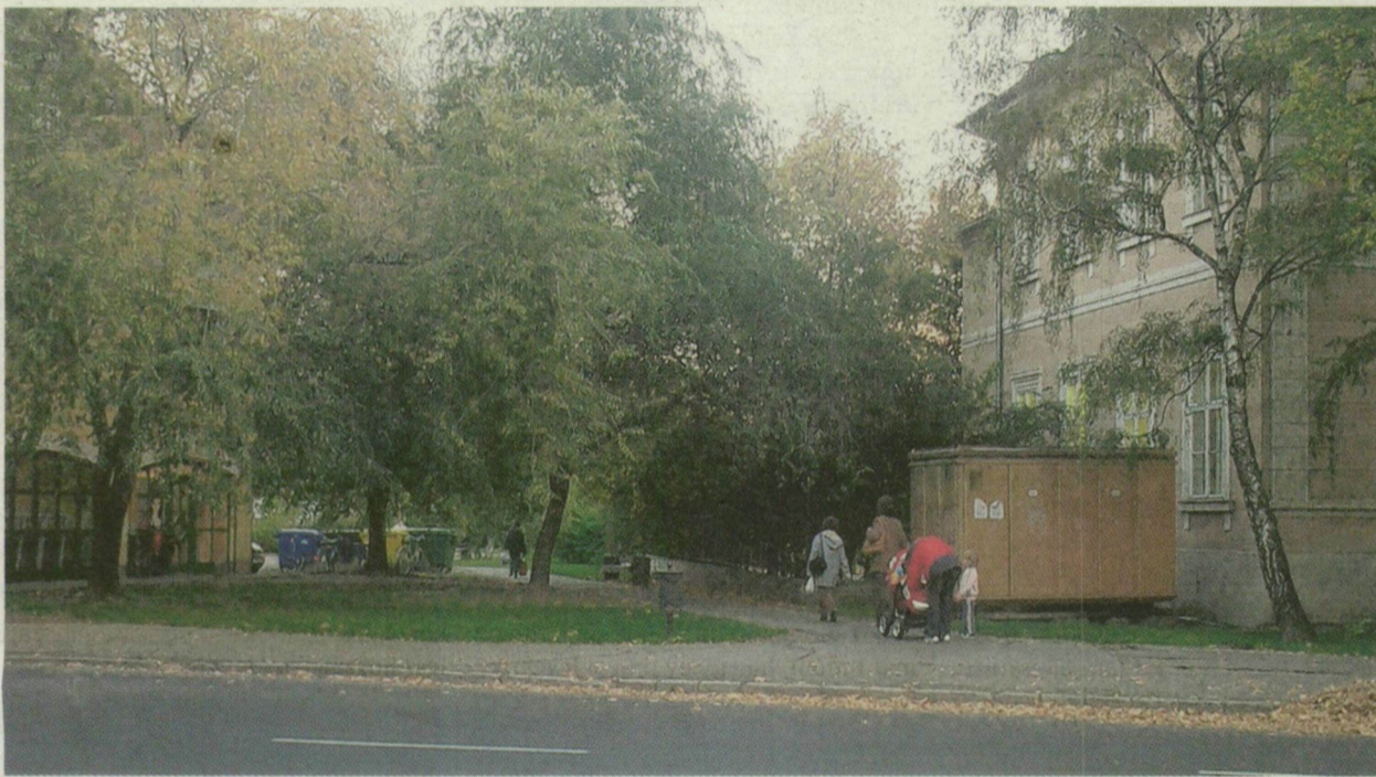
■ EGYKOR ITT ÁLLT PAUL NEWMAN ÉDESANYJÁNAK HÁZA