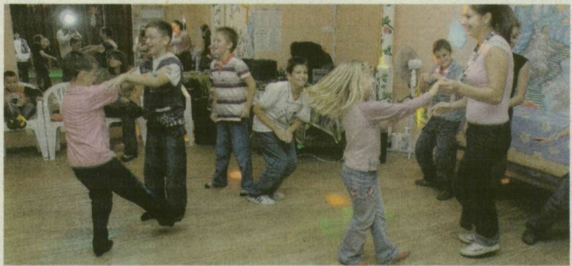
■ A DZSUNGELPARTIN A GYEREKEK IS KIPRÓBÁLHATTÁK A DISZKÓT

A partin egyébként igazi DJ szolgáltatva a talpalávalót, akitől zenét is kérhettek az apróságok. - Azokat a számokat szeretik, amelyeknek a szövegét is ismerik. A Neoton Família Don Quijote című számát vagy a Kistéhen zenekartól a Cybergyereket nagyon tudják - mondta a lemezlovas, Roland.