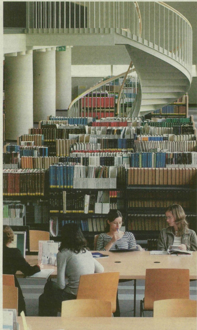
AZ INFRASTRUKTÚRÁVAL IS ELÉGEDETTÉK A SZEGEDI HALLGATÓK

A vádlott még több alkalommal találkozott T. L.-lel, akinek elmondta: ismerősének legalább 2 millió forintot kell fizetnie azért, hogy ne menjen ki több emberrel a lakásába, ott megverje, házat felgyújtja. T. L. ezeket a fenyegetéseket elmondta ismerősének, aki feljelentést tett a rendőrségen.