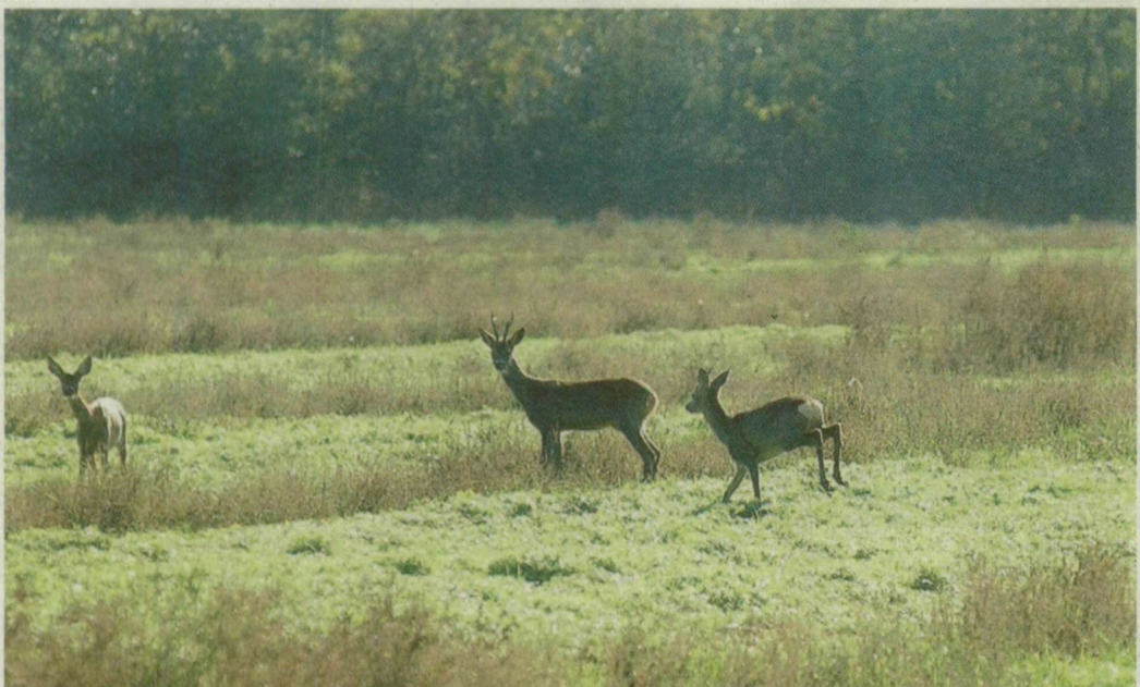
JÓKEDVŰ ŐZGIDÁK - A hűvös szeptember után meleg napokkal kényeztetett minket az október. A kép tanúsága szerint nem csak az emberek élvezik a vénasszonyok nyarát: vidáman szaladgálnak a fiatal őzek az ásonthalmi földeken.

Szexbotrányba keveredett egy floridai választókerület demokrata párti képviselőházi képviselője, aki republikánus elődje szexbotrányának köszönheti helyét az amerikai törvényhozás alsóházában. 2006 októberében a republikánus Mark Foley lemondásra kényszerült, mert szexuális molesztálással feléő e-maileket küldött középiskolás korú kongresszusi gyökörökfiúknak. Most Foley utódjáról, Tim Mahoney-ről derült ki: házasságon kívüli kapcsolatba keveredett egy nő munkatársával, akinek később 121 ezer dollárt (23 millió forint) fizetett, hogy hallgasson, és ne perelje be szexuális zaklatásért.