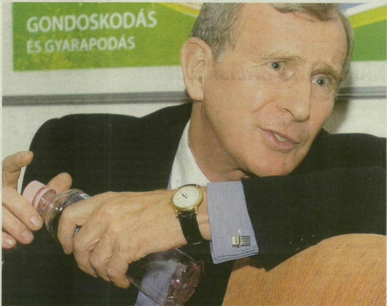
■ A GAZDASÁGI VÁLSÁG SZÉLÉN VAGYUNK - FIGYELMEZTET JÁRAI ZSIGMOND

sági válság szélén vagyunk. A finanszírozási igényt csökkenteni kell, azonnal. Ha nem változik a helyzet, 2009-ben a kisvállalkozások már nem tudnak majd annyit termelni, mert nem bírnak hitelt felvenni a bankoktól - a devizahitelezés máris komolyan visszaesőben van. Így sok cég csödbe mehet, a dolgozói utcára kerülnek, a növekvő munkanélküliség visszafogja a keresletet, újabb vállalkozásokat rántva csödbe - vázolta az egykori jegybankelnök, aki lapunknak megoldási javaslatát is ismertette: pénzt kell