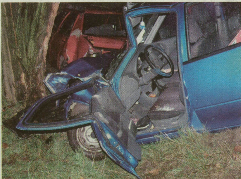
■ VASÁRNAP A SUZUKI ÉS A NÉGY UTASA IS MEGSÉRÜLT